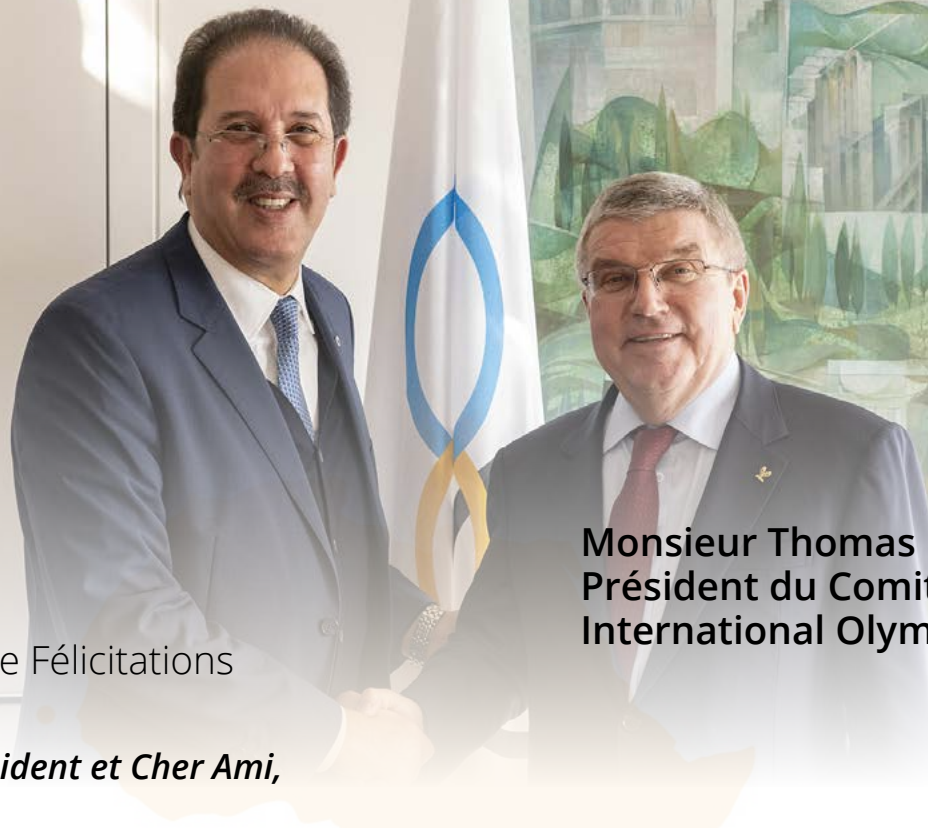
Monsieur Thomas Bach, Président du Comité International Olympique